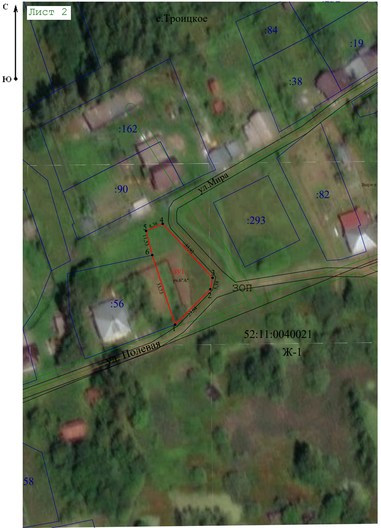
Схема расположения земельных участков